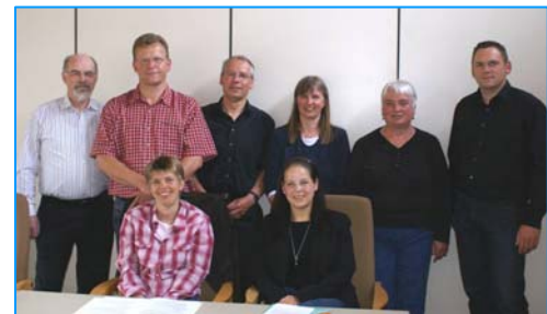
Gründungsmitglieder Mai 2008

gegründet worden. Die Gründungsversammlung hat am 27. Mai 2008 im Bürgerhaus in Klausdorf (Schwentinental) stattgefunden. Dieses Netzwerk soll ganz bewusst keine geschlossene Gesellschaft sein, sondern jeder Bürger ist zur Teilnahme an den Sitzungen dieser Gruppe eingeladen und kann sich als Mitglied anmelden.